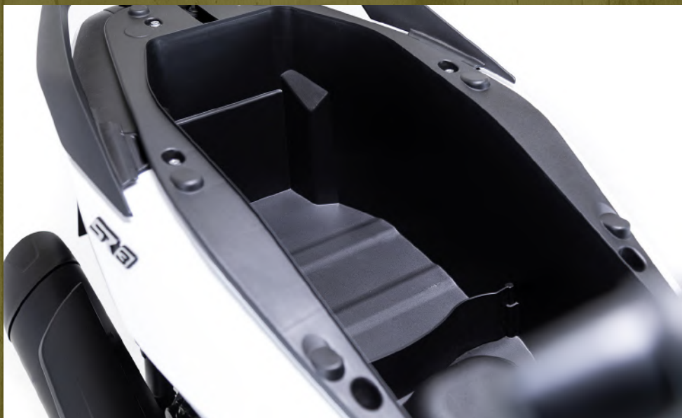
Baúl bajo el asiento