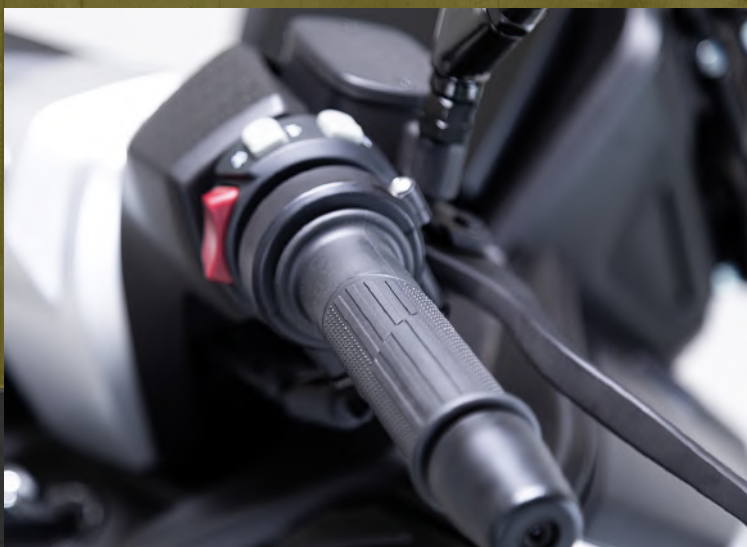
Puños calefaccionados (*)