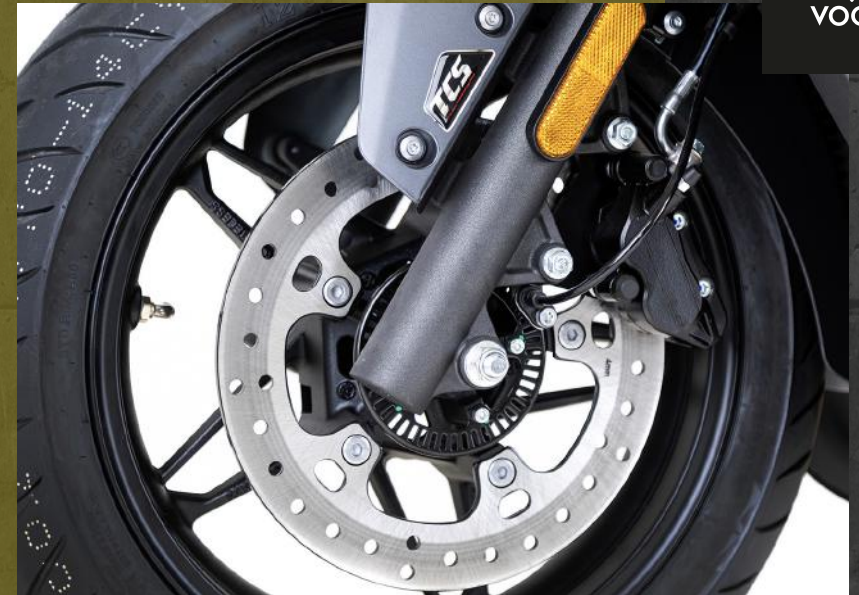
TCS (Control de tracción) desconectable. (*)