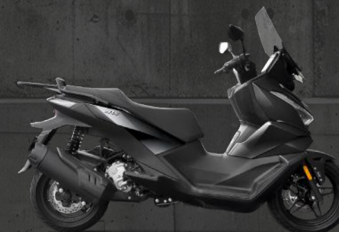
Titanium Silver Grey