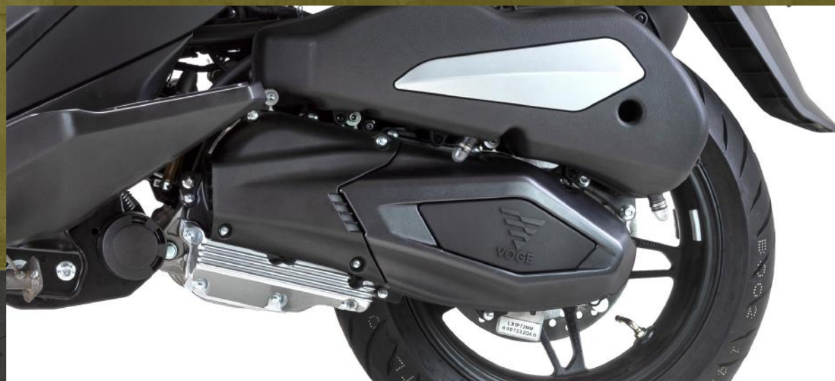
Motor monocilíndrico 244cc - 25hp - EFI - Refrigeración líquida

(*) Único producto del segmento en incorporar esta tecnología