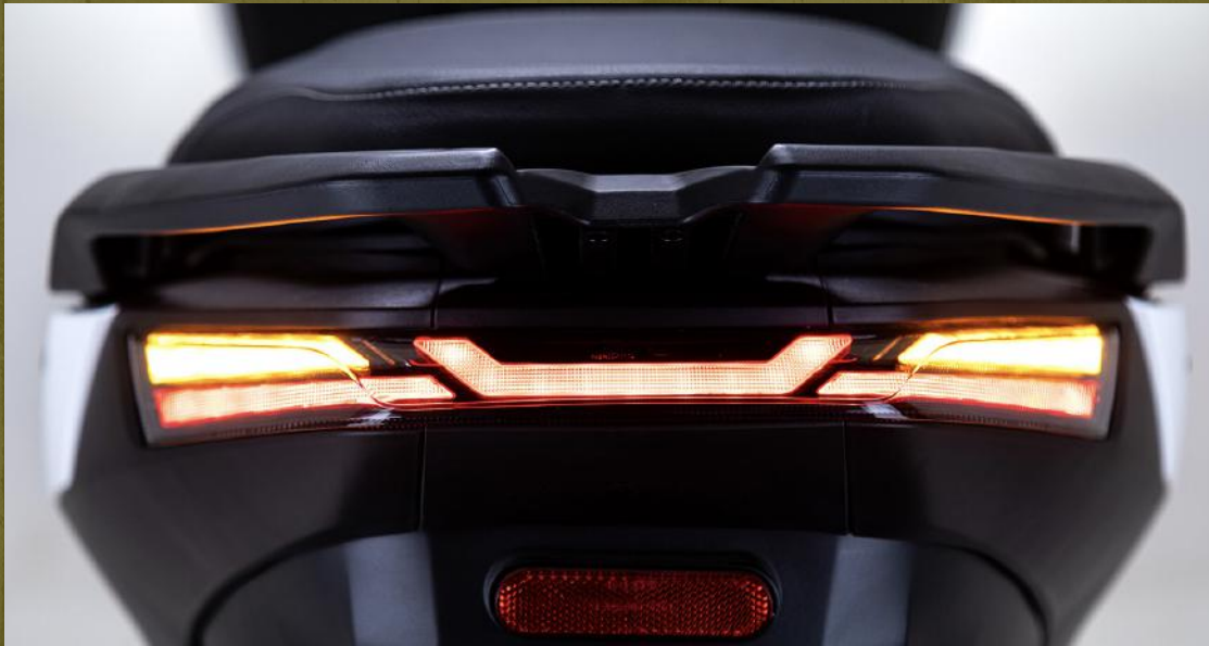
Iluminación full LED