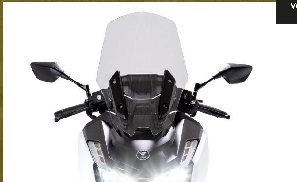
Parabrisas regulable en altura