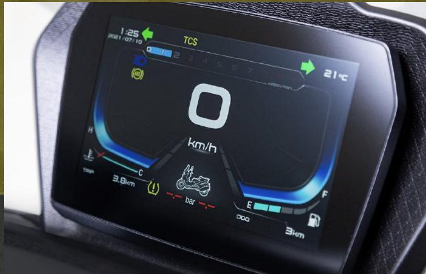
Pantalla TFT 7"