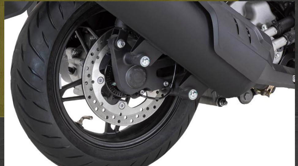
ABS en ambos ejes (*) Freno de disco del. y tras.

(*) Único producto del segmento en incorporar esta tecnología