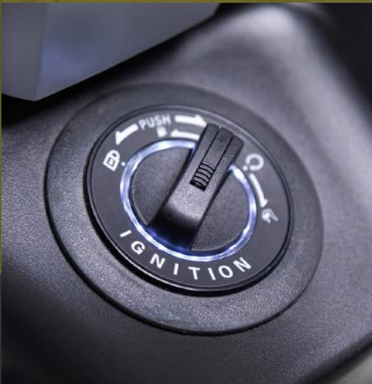
Arranque keyless (*)